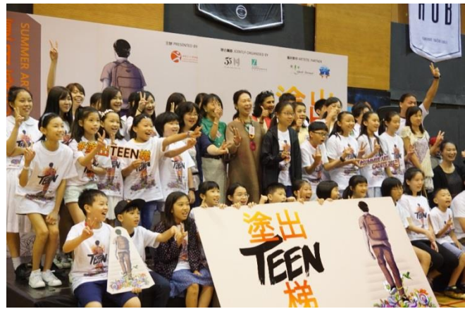
4. 一眾嘉賓與「塗出 Teen 梯」學員大合照，分享成果的喜悅。