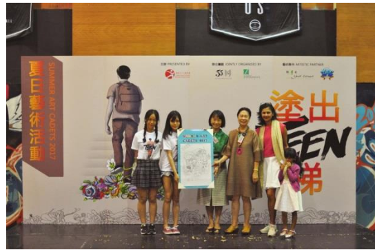
3. 「塗出 Teen 梯」學員致送紀念品予香港藝術館之友。