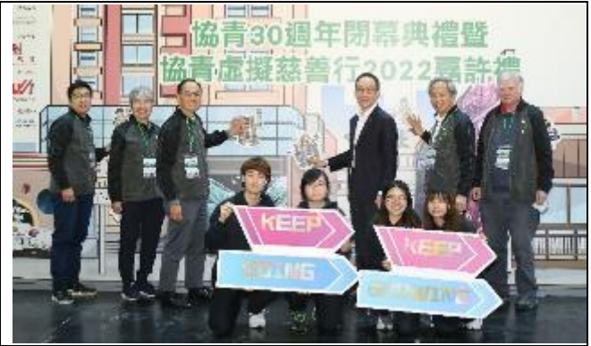
圖四至五：主禮嘉賓及一眾嘉賓和青年人回顧 YO 30 週年花絮片及共同為 30 週年進行閉幕儀式。