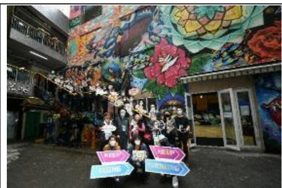
圖十一至十二：一眾嘉賓和青年人一同合照留念。