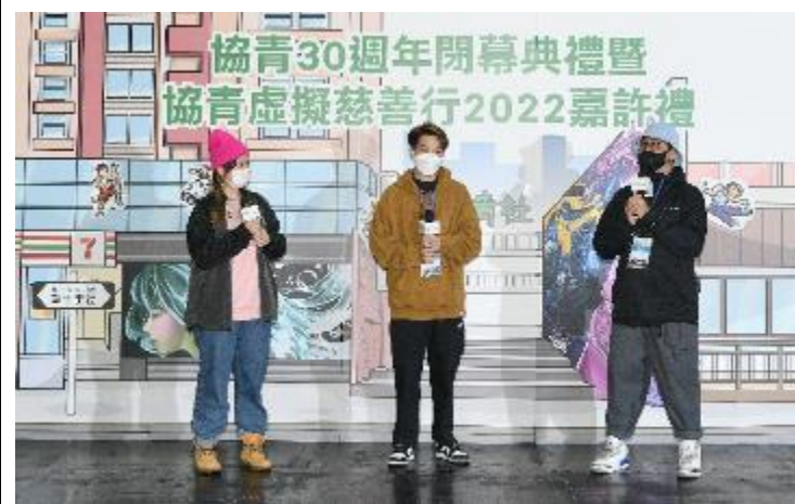
圖六：藝術家分享參與青年街頭塗鴉文化推廣活動的感受。