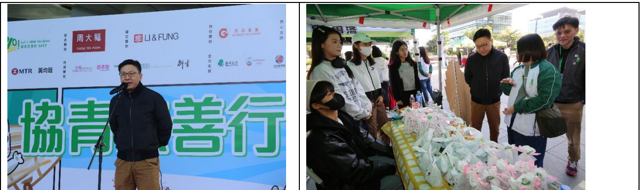
圖一至二：勞工及福利局局長孫玉菡，JP 出席協青慈善行 2023 活動，並祝願 YO 繼續與青年同行，為青年提供多元化的活動，並參觀「青年文化攤位」支持青年。