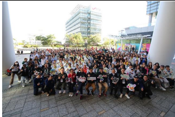
圖十二：一眾嘉賓與青年人一同合照留念。