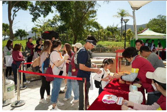
圖五至六：活動以嘉年華形式呈現，設有由 YO 青年人策劃的「青年文化攤位」如泰拳體驗、飛鏢體驗、手工藝攤位等。