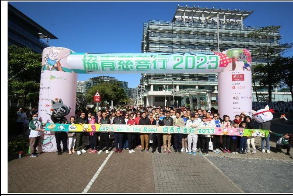
圖十三：一眾嘉賓手持彩帶，主持協青慈善行 2023 起步儀式。