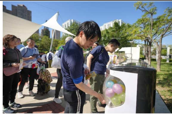
圖十四至十七：活動現場由 YO 青年人創作的 Y.O. 貓咪大使亮相各攤位為各參加者打氣，透過「青年文化攤位」，讓參加者能夠體驗到多元化的活動。