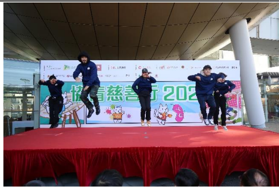
圖十至十一：青年們為協青慈善行 2023 典禮帶來精彩表演。